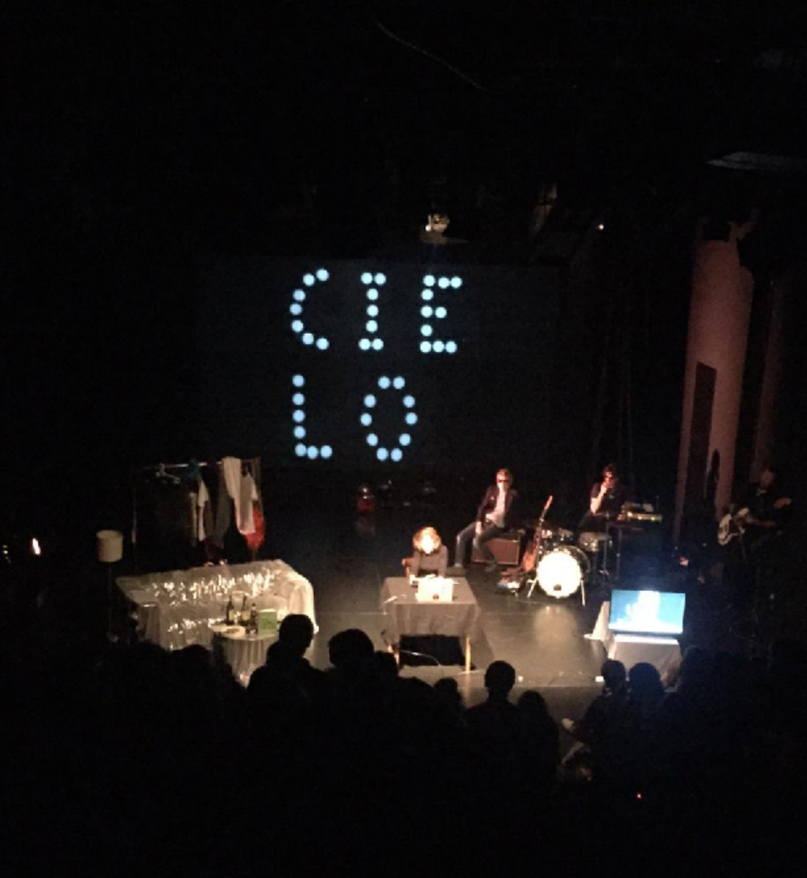
Marc Caellas / David G. Torres Barcelona, enero 2020